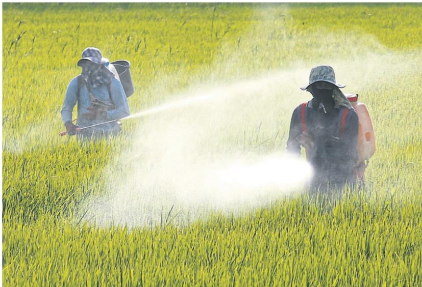
Farmers spray pesticide in a rice field. The national hazardous substances panel won't ban three toxic chemicals. PATTARAPONG CHATPATTARASILL

"The network is considering to appeal to the court," he said.